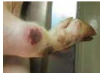
圖：關節腫脹伴隨皮膚壞死