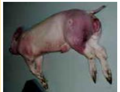
圖：皮下出血及血便