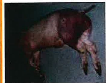
圖：皮下出血及血便