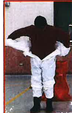
脫除Tyvek防護衣，最後將鞋套口反折連雨鞋一併脫除