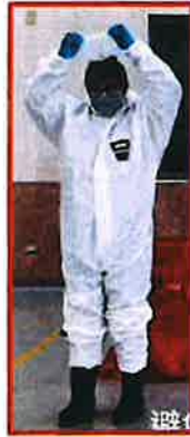
防護裝備由上向下脫除， 脫除面罩、頭套及口罩