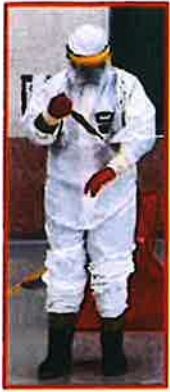
撕除手部及腳部膠帶