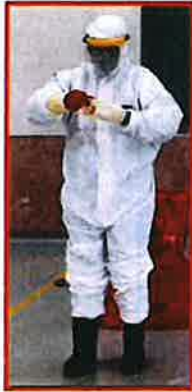
小心反轉脫除外層手套